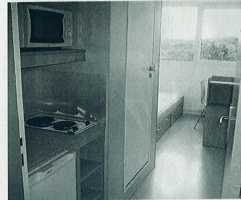
Les nouvelles chambres seront équipées d'une cuisine et d'un frigo individuels.

Le foyer, sorti de terre en 1964, accueille les jeunes de 16 à 30 ans en mobilité professionnelle. Le bâtiment n'a pas connu de rénovation depuis vingt-cinq ans. Les premiers coups de pelle débuteront le 8 octobre. Les travaux, qui doivent durer un an, vont donner une seconde jeunesse aux 85 logements répartis sur trois étages, devenus très vétustes.